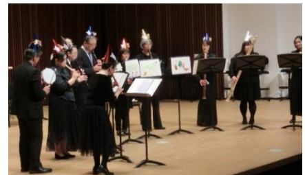
クリスマスコンサート